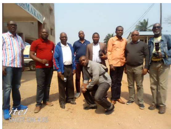
itel SHOT ON A35 Réunion avec UNIPROL à Mbanza Ngungu