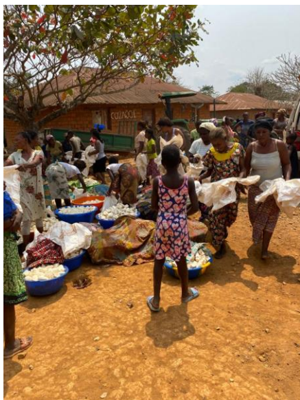
Les Mamans vendent leur manioc à Zamba

Le matin: Visite à Zamba où les Mamans vendent leur manioc au centre Agro-alimentaire de CIVAK