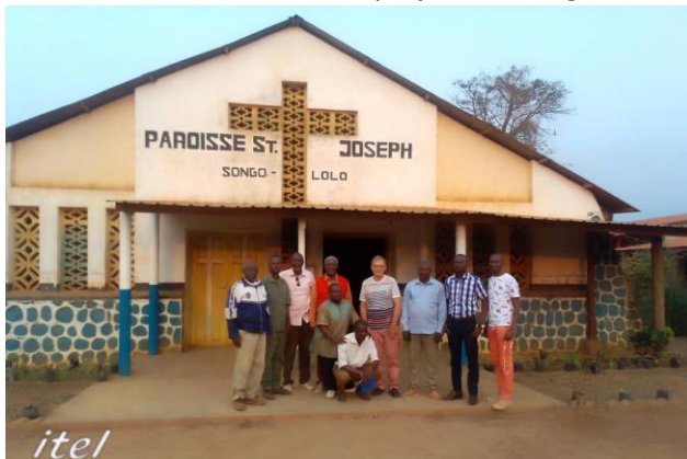
itel Songolo paroisse St Joseph

Il est important de signaler ici: que toute subvention à attribuer par la Province de Flandre occidentale ira à 100% aux projets au Congo. ABCONGO et VIVES s'appuient sur les efforts des