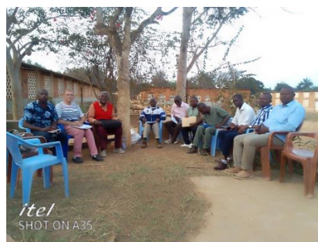
Réunion avec les membres d' UPROL à Songolo

Le financement de ce futur SYNERGIE-projet doit encore être examiné. La première