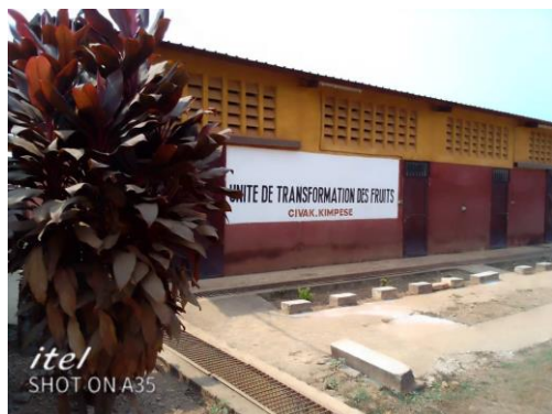
jus de fruits CIVAK

Visite aux sites de production divers de CIVAK :