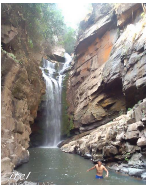
Cascade VAMPA à Kimpese

Visite de la cascade VAMPA à 3 km du centre de Kimpese. Au pied des Montagnes de Cristal, il y a des champs très bien entretenus d'agriculteurs qui sont tous fournisseurs de CIVAK.