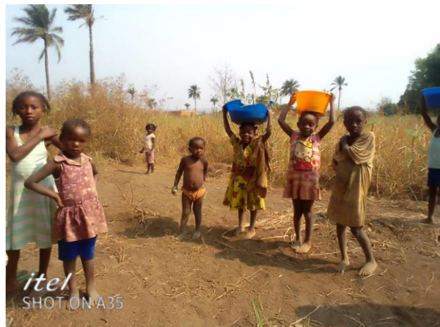
Des enfants dans les champs de Mbanza Ngungu

Un dimanche sans messe était impensable ici. Dans la paroisse Sainte-Marie, l'ambiance avec la chorale et les danseuses était incroyablement belle. L'église et les bâtiments de l'ancienne mission ont été bien conservés et entretenus et sont toujours utilisés aujourd'hui. A Kimpese, l'église n'a pas encore évolué jusqu'en 2021 comme en Belgique. Les femmes y sont encore « soumises ».