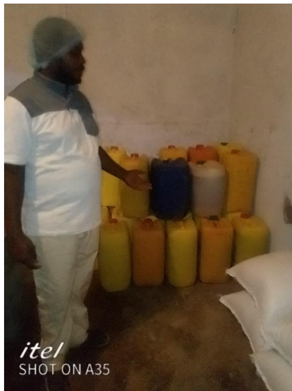
CIVAK mini-zoning : Fermentation du vin de maïs Divinus

Cela concerne l'installation de fermentation, l'achat de matières premières, bouteilles et autres petits matériels. Ainsi que la remise à neuf hygiénique d'un atelier de production de vin de maïs de sa propre marque DIVINUS . Civak accompagnera ce jeune, comme plusieurs autres bénéficiaires, dans son entreprise pendant encore 1 à 2 ans.